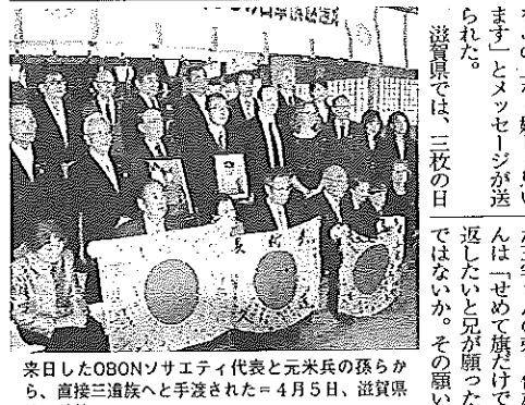
来日したOBONソサエティ代表と元歩兵の孫らから、直接三遺族へと手渡された。4月5日、滋賀県園田神社で

OBONソサエティは、日章旗の返還活動を行っており、3県で日章旗の返還が実現した。OBONソサエティの代表と日章旗を保管していた元歩兵の孫が来日し、直接遺族へと手渡された。