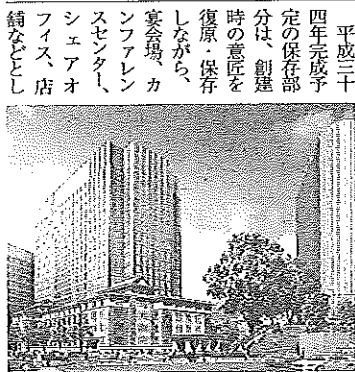
九段会館の一部保存と建替えの完成予想図

東急不動産株式会社と鹿島建設株式会社が出資する合同会社「ノウエグランド」は、東京都千代田区九段南一丁目一丁に所在する九段会館および同敷地について、平成二十二年三月一日に同との間で合意書を締結し、七十年間の定期借地による九段会館の一部保存・建て替え事業に着手し、工事が始まった。