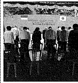
全戦没者追悼式で黙祷を捧げ亡き父たちの冥福を祈る。1月25日、ビアク島で

とちやんと風呂から出て裸で角力をとつていたら、前の路地から役場の人が提灯をさげて右果合状を持って来たので、父は着物を着て迎えたところから聞きました。とちやんとは喜んでいてと母は私にうらめしく話してくれました。 昭和十一年九月十八日の父の日記の最後に、先中村一家の光栄するところ、有(天皇陛下萬歳)で終っていました。お父さんは日中戦争に参加することを待って居たのです。ここに来る前にお父さんの手紙を讀みかえして来ました。鉄道敷設の勤務の中で手紙を書くのは大