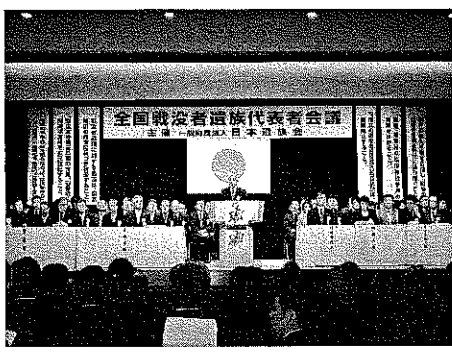
全国戦没者遺族代表者会議で出席者にお礼の挨拶を述べる尾辻秀久本会会長=1月15日、自由民主党館8階ホールで