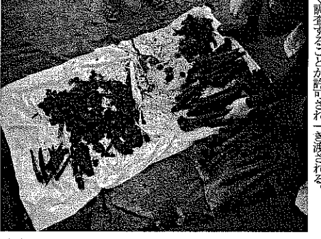
収容した遺骨を鑑定する国立博物館員=1月23日、タロキナで